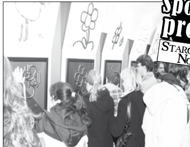
Nadace Artevide www.artevide.cz

Studio Oáza pečuje o lidi s mentálním postižením. V provozu od roku 1992. Sídli v Řiční na Kampě.