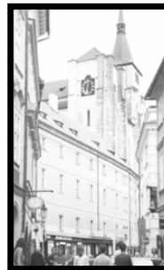
KOSTEL sv. Jiljí