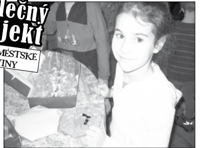
Ateliér Loukamosaic www.femancipation.com

Nadace Artevide se zabývá mimo jiné uměleckou tvořivostí zrakově postižených dětí (obrazy).