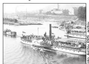
Parník primátor Dittrich.

Téhož roku spustil na vodu svou první loď: Prahu (Prag). Na primátora to dotáh až v 69 letech. Zemřel v Praze dne 21. října 1875.