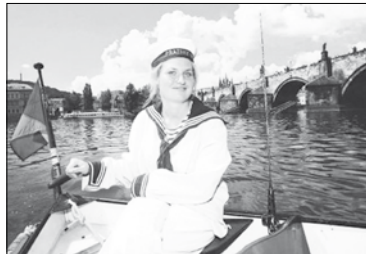
JÍZDA z Dětského ostrova k Národnímu divadlu trvá 10 minut.