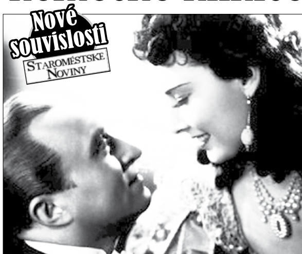
FILM Dívka v modrém vznikl dva roky po narození dítěte.

Žena Oldřicha Nového si ho každý večer po představení vyzvedávala v divadle.