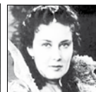
Lída Baarová, herečka

Pavel Tigrid: † 31. srpna 2003. Posledních deset let žil v ulici U Starého hřbitova s výhledem na židovské náhroby. Dlouhá léta v exilu. * 1917.