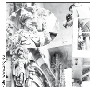
BEZ sítě zkrásněl a ví to.

JIRÁSKŮV MOST - Velká zelená skvrna (40 x 5 m) se objevila na přelomu července a srpna na hladině Vltavy. Hasiči ji přemohli normými stěnami. Do vody se dostala z kanalizace. Prý nebyla zdraví nebezpečná a šlo o jíl.