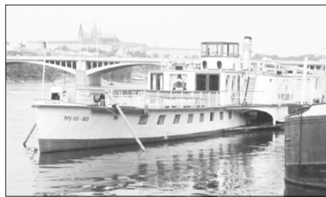
Parník Vltava se vrací, krásnější než dřív.

Večerní Praha 30. 9. 1991: „Dnes se parník Vltava po opravě představuje v plné kráse jako plávoucí restaurant. Práce si vyžádaly náklady asi šest milionů korun z toho půlku nové srdce parníku - kotel.“