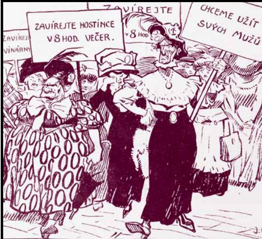
MANIFESTAČNÍ PRŮVOD ŽEN za zkrácení zavíracích hodin v hostincích.