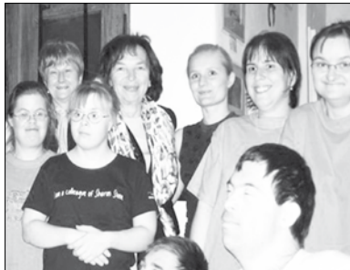
Studio Oáza www.special.cz/oaza

Rozhlédněme se kolem sebe a označme subjekty, které potřebují naši podporu. Staroměstské noviny pak uveřejní nejen jména těch, kteří dar věnovali, ale i těch, kteří navrhli, komu má být určen.