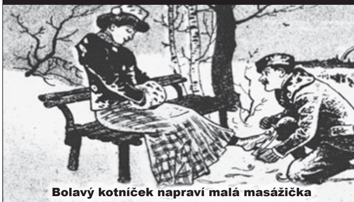
Bolavý kotníček napraví malá masážička

Staroměstské noviny k počtě Humoristickým listům (1919)