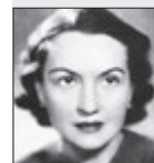
Marie Rosůlková HEREČKA