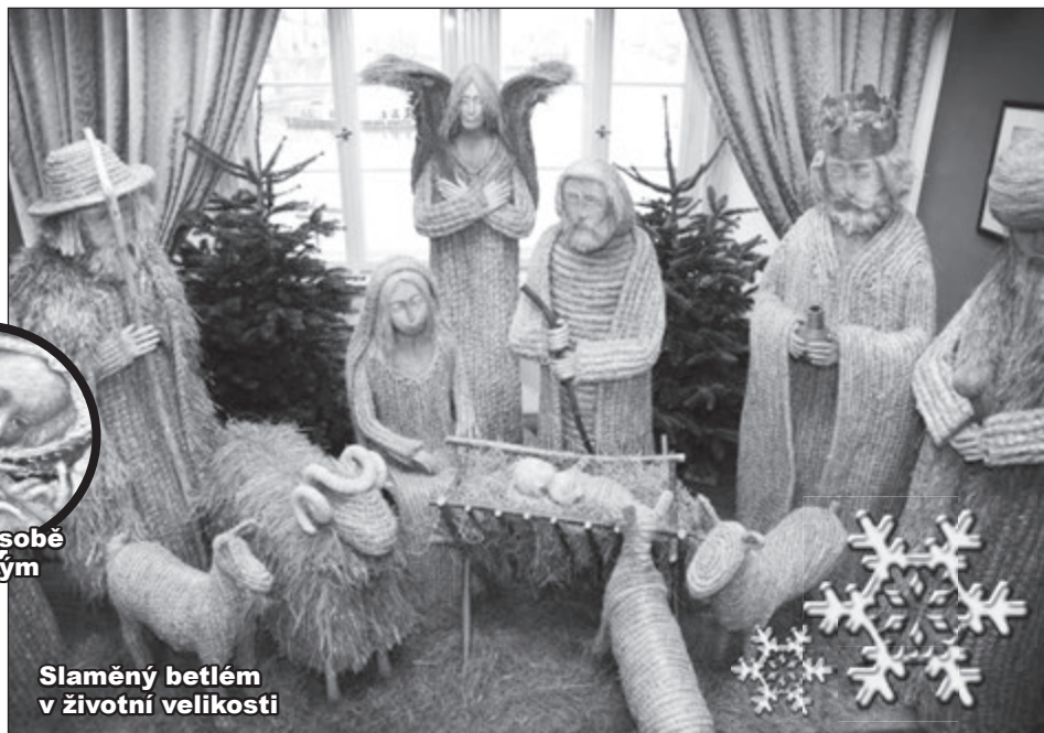
Slaměný betlém v životní velikosti