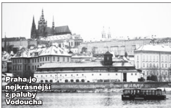
Praha je nejkrásnější z paluby Vodoucha