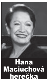
Hana Maciuchová herečka