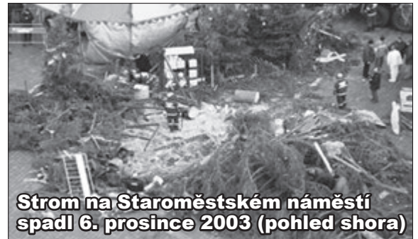
Strom na Staroměstském náměstí spadl 6. prosince 2003 (pohled shora)

při takovém poryvu spadl strom na Staroměstském náměstí 6. prosince v roce 2003 a zranil čtyři lidi. Tehdy měřil 30 metrů a od té doby se staví menší - i letos měří smrk „pou- hých“ 22 metrů. Dojetí plného náměstí umocnil fakt, že se vpod- večer začal snášet prv- ní letošní sníh - sice jen drobounké vločky, které rychle tály, ale i tak!