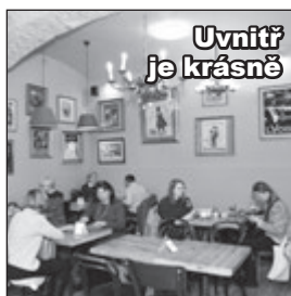
Uvnitř je krásně