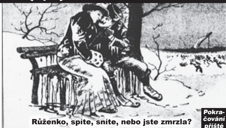
Růženko, spíte, sníte, nebo jste zmrzla?