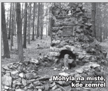
Mohyla na místě, kde zemřel