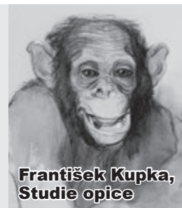
František Kupka, Studie opice