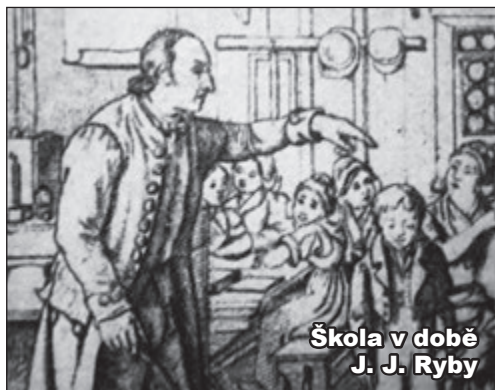
Škola v době J. J. Ryby