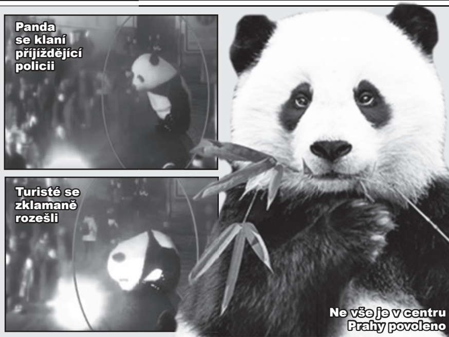
Panda se klaní příjždějící policii

Panda je v čínštině složenina slov „medvěd“ a „kočka“.