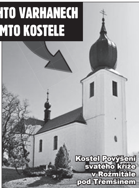
Kostel Povýšení svatého kříže v Rožmitále pod Třemšínem