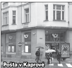
Pošta v Kaprově

Konec starých časů - tak by se dala shrnout situace okolo poboček České pošty v Praze 1. Pošta pobočku v Josefské ulici na Malé Straně „nepotřebuje“ a magistrát, v jehož budově se pobočka nachází, chce objekt rekonstruovat pro gymnázium. V době datových schránek, mobilů a různých služeb na dodání balíčků, asi skutečně chodí na poštu stále méně lidí. Já patřím mezi ty staromilce, které služby České pošty stále využívají. Navíc Josefská, kam podle bydliště spadám, mi za ty roky přirostla k srdci. V ohrožení je ale i pobočka na Starém Městě v Kaprově ulici, která