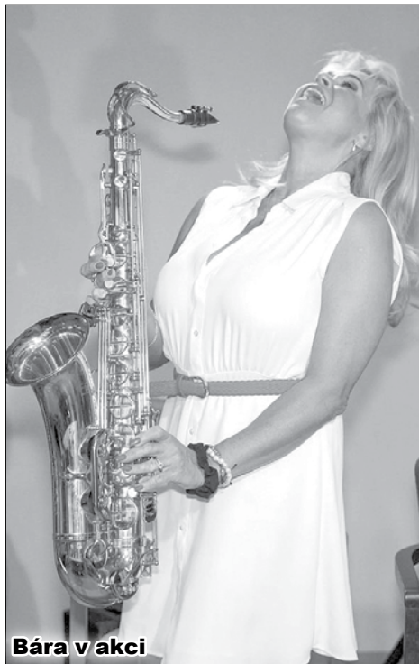
Bára v akci