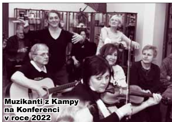
Muzikanti z Kampsy na Konferenci v roce 2022