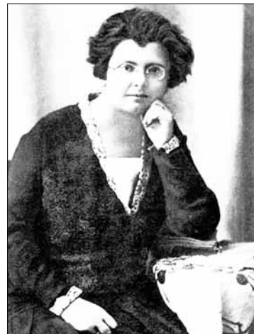
JARMILA Hašková, roz. Mayerová

Téhož roku vymyslel Švejka, založil Stranu mírného pokroku v mezích zákona a počal syna Richarda . Rozvedl se dva roky na to.