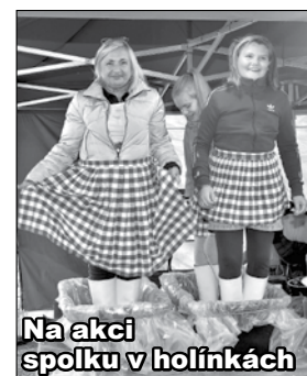
Na akci spolku v holínkách