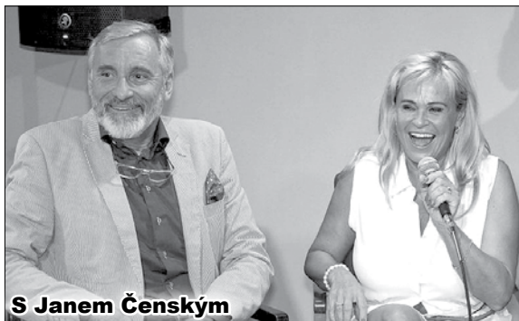
S Janem Čenským

Moc se těším na nový pořad o Janu Werichovi, který připravuji. Bude se to hrát u něj doma ve Werichově vile. A samozřejmě se těším léto a na setkání s vámi, diváky, protože bez vás by to nešlo.