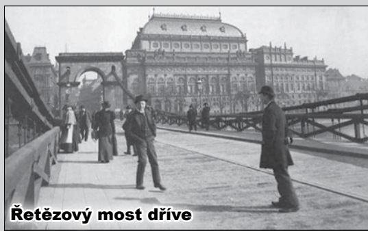
Řetězový most dříve