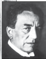
Div. partner Eduard Vojan