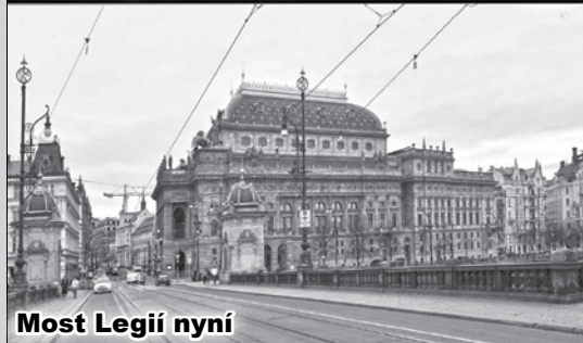
Most Legií nyní